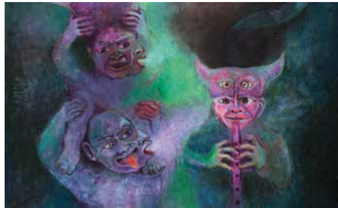
Historia del perro verde (detalle), 1963. Óleo sobre tela, 162 x 130 cm