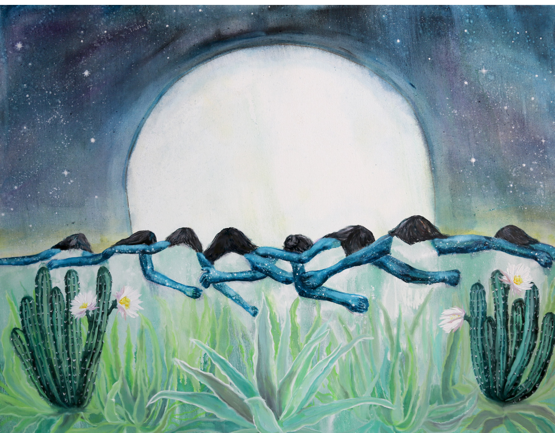
TEA, la luna en el centro de la tierra 2024 Óleo sobre lienzo 100 x 130 cm